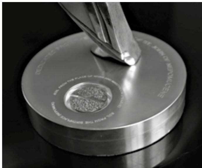
Detail podstavce sošky s kazetami se zemi, foto Pavel Motejzík