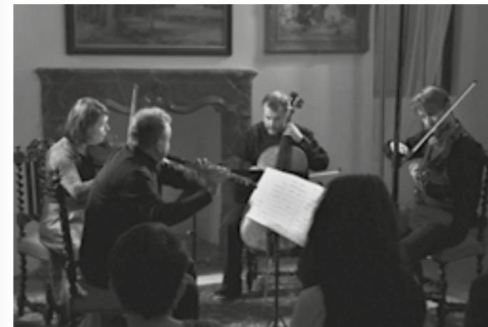
Rybův festival 2019, Březnice, Škampovo kvarteto

Podpořit festival můžete zde: https://www.hithit.com/cs/project/5607/festival-jakuba-jana-ryby-aneb-nechte-rybu-vyplout Zdroj: www.rybuvfestival.cz a crowdfundingový portál Hithit