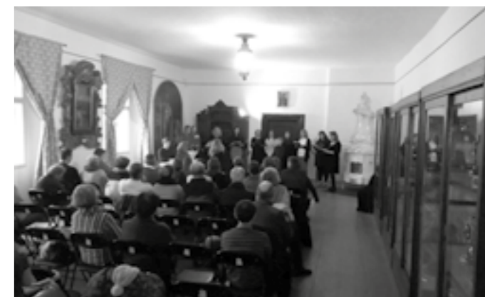
Tříkrálový koncert dne 4. ledna 2020