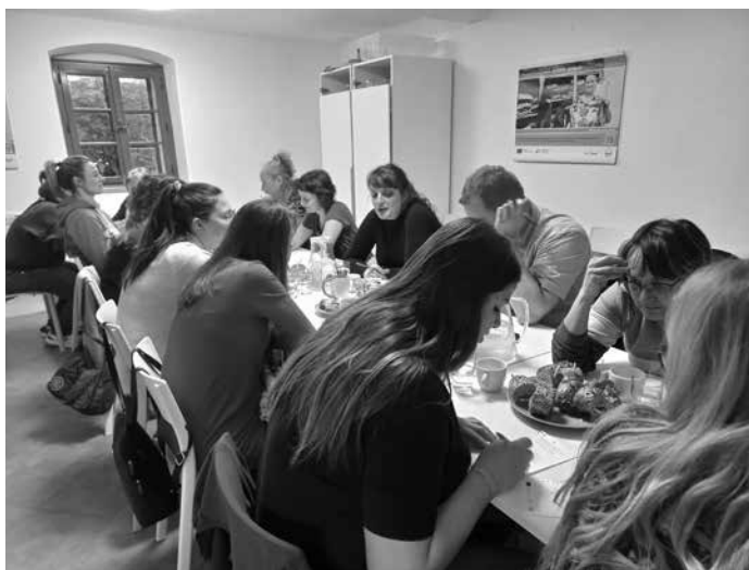
Společné jednání pracovních skupin MAP IV 23. ledna, foto Pavlína Jandošová

Díky navazujícímu projektu MAP IV pokračujeme v podpoře zkvalitňování vzdělávání ve školách na Nepomucku a Spálenopoříčsku. Cílem projektu je podpora spolupráce škol, zřizovatelů a ostatních aktérů, která bude zacílena na aktivity pro zvyšování kvality předškolního, základního i neformálního vzdělávání a současně umožní společné řešení místně specifických problémů v oblasti rozvoje školství.