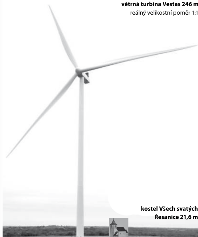
Porovnání velikosti větrné turbíny se současnou dominantou krajiny

Po tomto zjištění mé tělo zaplavují stresové hormony, ale následně ještě pohlížím na podepsanou smlouvu o spolupráci s obcí Nezdřev. Z toho, k čemu se obce a vlastníci pozemků upíší, mi vstávají hrůzou vlasy na hlavě, ale to by bylo na samotný rozbor.