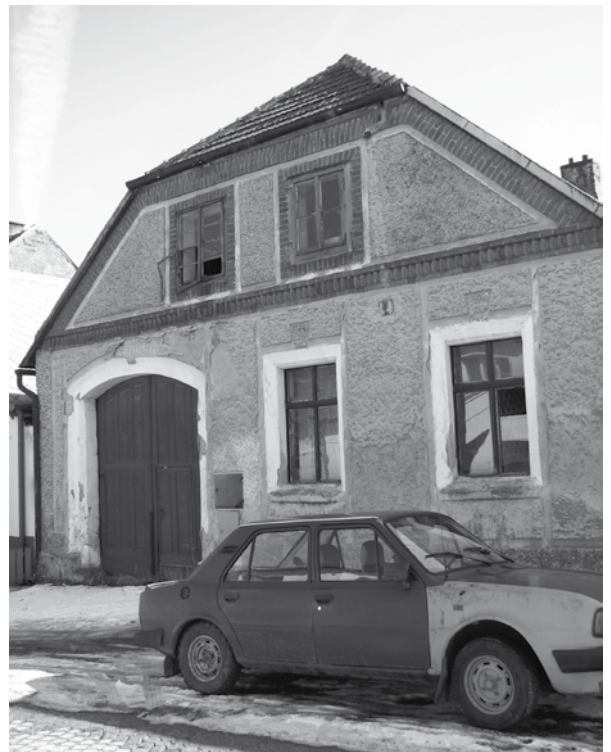
Jeden z podpořených domů před obnovou, foto archiv Pavla Kroupy

Pavel Kroupa, předseda Komise památkové péče