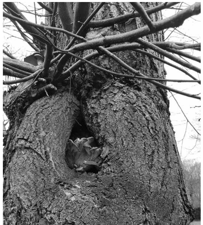
Lípa napadená dřevokaznou houbou v aleji u Sokolovny