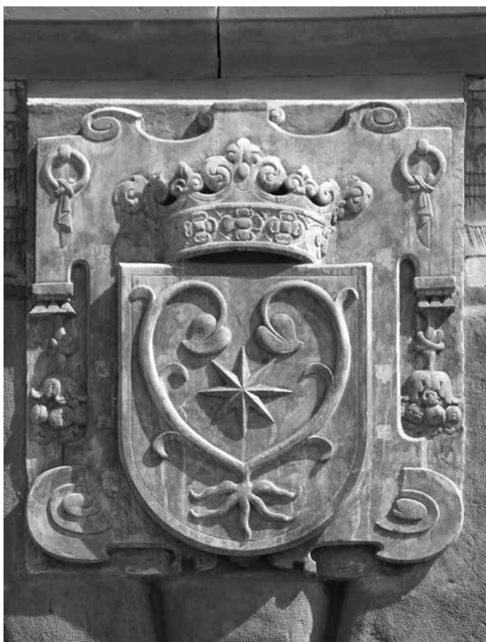
Praha, Hradčanské náměstí – erb nad vstupním portálem Martinického paláce

Když se zadíváme na dnešní kostel sv. Jana Nepomuckého, mělo by nám vytanout na mysli nejen jméno Kiliána Ignáce Dientzenhofera, dle jehož plánů je chrám postaven, ale rovněž jméno jednoho významného říšského a českého šlechtice, politika a diplomata: Adolfa Bernarda z Martinic (1679–1735). To on rok před svou smrtí inicioval a financoval přestavbu nepomuckého kostela, protože původní pro potřeby poutníků už nevyhovoval.