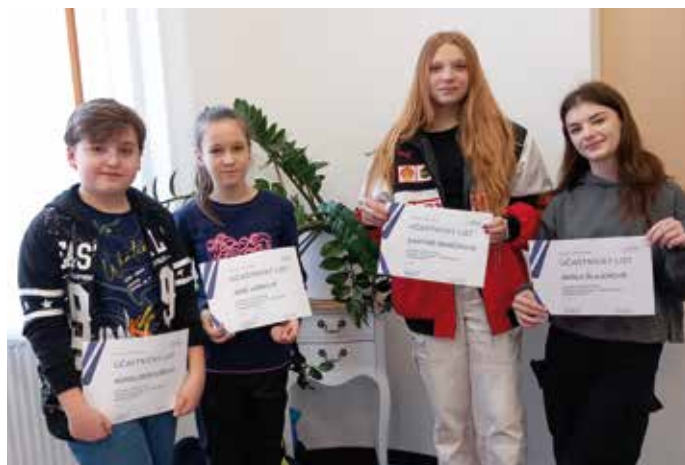
Účastníci okresního kola olympiády v angličtině

Šestáci navštívili Západočeské muzeum v Plzni. Přírodovědná