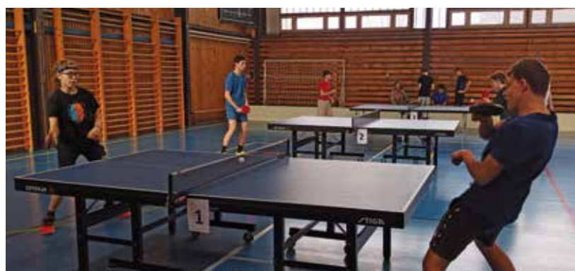
Krajské kolo ve stolním tenisu