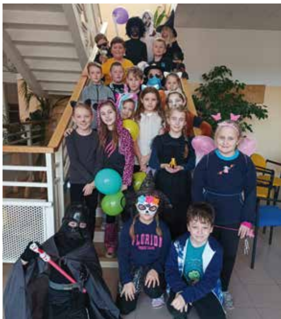
Masopust ve 3. B