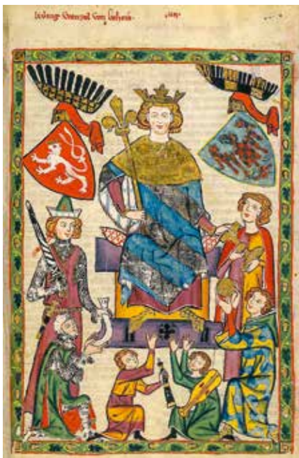
Václav II. na vyobrazení z Velkého heidelberského zpěvníku z počátku 14. století