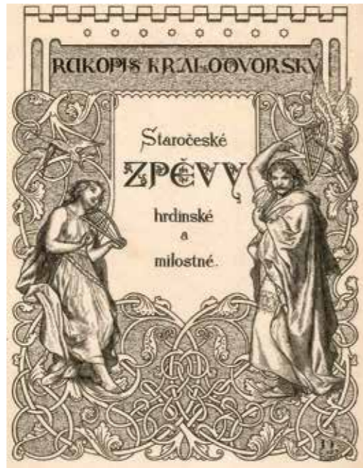
Vydání z roku 1861 s obálkou od Josefa Mánesa