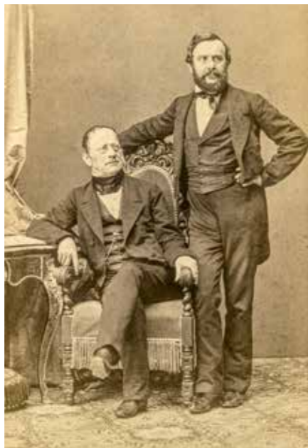
Vlastenci Palacký a Rieger