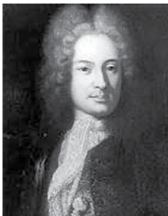
Josef Emanuel Fischer von Erlach