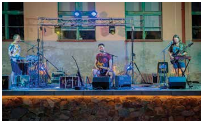
Květy vystoupily na MLS 5. srpna, foto Martin Myslivec.

Srpnové páteční večery patřily například brněnské alternativní skupině Květy nebo plzeňsko-klatovsko-nepomucké kapele Brenda 5.